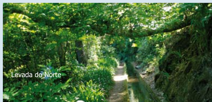
Levada do Norte