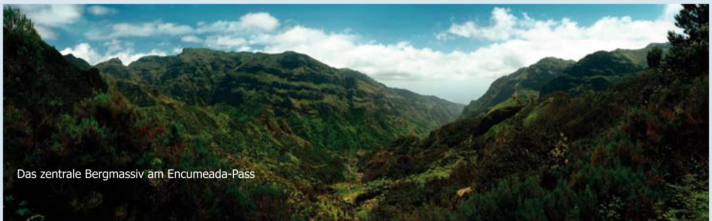
Das zentrale Bergmassiv am Encumeada-Pass